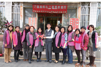
▲ 總會魏理事長致贈慰問金