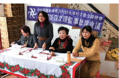
▲ 理監事會議, 熱烈討論校慶活動