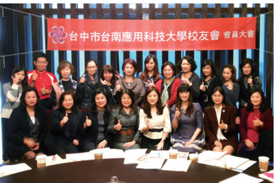
▲ 楊理事長捐款台中校友會