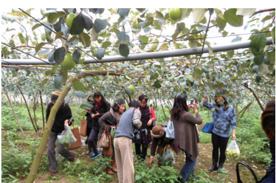
▲ 還有野生無農藥的蔬菜可採, 好開心!