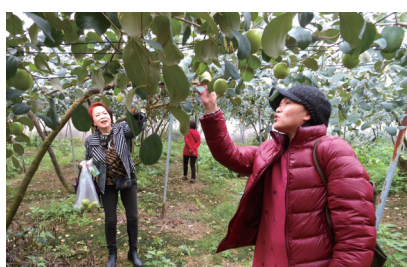
▲ 採果樂-大夥兒在棗子園採得不亦樂乎!