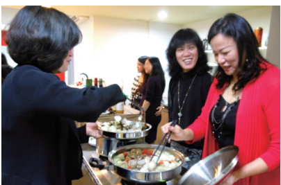
▲ 校友們熱情的準備菜餚