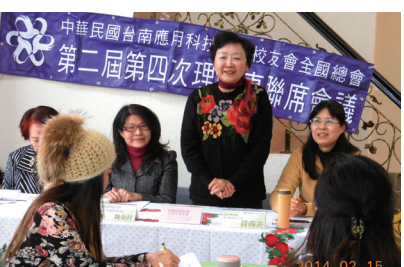
▲ 理監事會議, 熱烈討論校慶活動