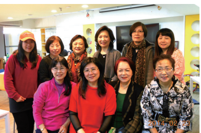
▲ 好姐妹們合影留念