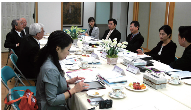
▲ 參訪來賓與本校主管座談會

參訪期間，來賓除觀賞學校DVD簡介外，也參觀本校刺繡研發中心、校史館、數位影音中心、服設館等，對本校校園環境讚美不已，認為本校環境優美，具濃厚學術氣息。來賓與本校主管於商學大樓一樓生活美學與創造力教室召開座談會，互相交流，相談甚歡，雙方於會議中規劃兩校合作方案，並針對教師、學生交流互訪進行討論，有利於日後推動兩校的實質交流合作。