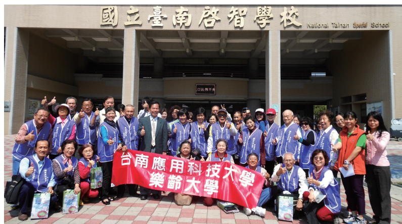
▲ 參訪啟智學校合影