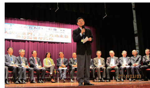
▲ 校長上台宣揚本校

此次參訪行程非常緊湊，除了參加香港各區的家長教師聯合說明會，也拜訪了香港理工大學、香港城市大學專上學院、香港專業教育學院、九龍工業學校、香港教育學院、