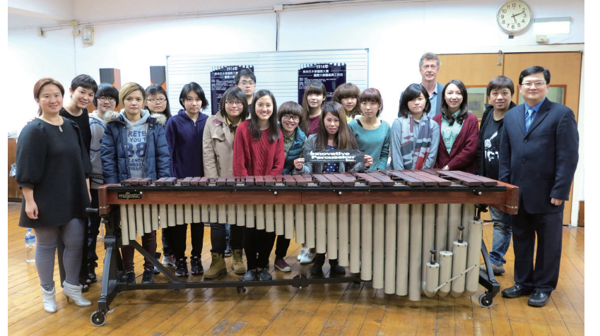
▲ 大師與本校師生合影

經由大師講座與工作坊一對一教學方式，讓學生在樂曲的詮釋、技巧、及肢體演奏方面有更豐富及更寬廣的表現，現場同學各個如沐春風，與大師的一席話更勝醍醐灌頂之效，並藉此達到本校所致力重點培育競賽人才之目的。