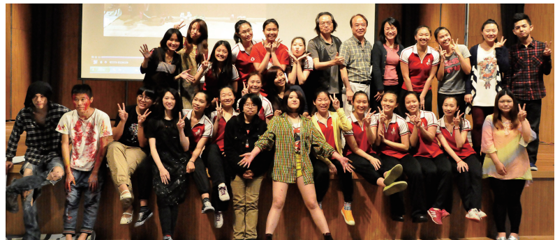
▲ 院集會活動大合照

演為主軸進行表演藝術。此次集會前不斷彩排與討論，最終以街舞、塗鴨藝術及流行音樂表演作為演出內容。表演過程人人咋舌驚嘆，也為同學開啟不同的藝術視野。