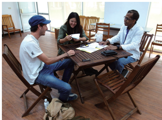
▲ 生動活潑的英語會話教學

學品質的企圖心，獲得教育部認同與肯定，順利取得第二期教學卓越計畫補助經費。當今各行各業都講求國際化的年代，聘任具大專院校教學經驗的外籍教師、改善英語教學環境，實為學校重點發展項目，學校將這得來不易的資源毫無保留地灌注於同學們身上，同學們當充分利用以不枉費學校一番苦心。