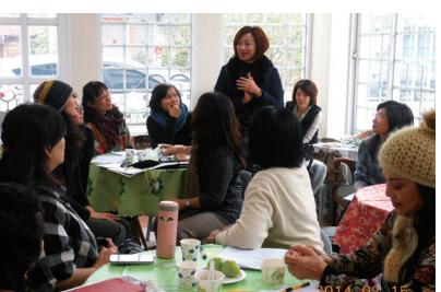
▲ 理監事會議, 熱烈討論校慶活動

103年2月23日台北市校友會舉辦新春團拜-1人1菜歡樂聚會, 分享拿手菜, 逗陣呷好料活動, 校友們相聚、話家常、笑聲中緬懷過去, 懷念學生時代...歡樂的相聚時光, 大家熱情互動, 非常開心。