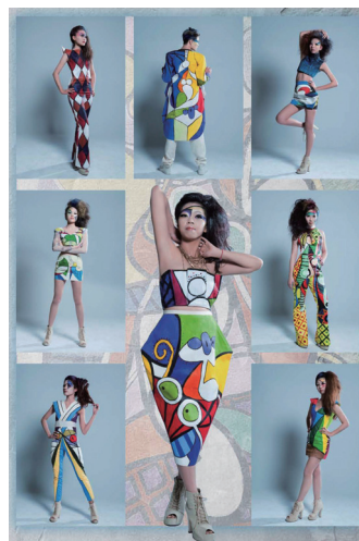
▲ 畢展造型之一畢卡索風格

美容造型設計系於3月7日（五）在本校乃建堂舉辦103級校內畢業動態展演-主題「經典」。透過多重面向的思索、觀察與發想，並結合創新的整體造型，嘗試多角度、多方位的再現年輕學子視野中的經典內涵。