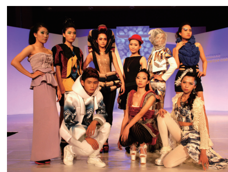
▲ 展演學生於舞台上合影

校外展演，將於4月20日（日）下午，在高雄的Dream Mall統一夢時代購物中心展出，歡迎蒞臨觀賞。（文圖：服飾系）