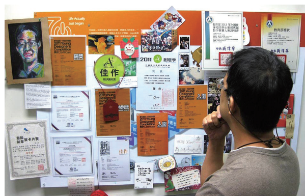
▲ 天增歲月師增慶。獎滿乾坤生滿門。橫批：生源不息

(一) 教師的責任 1. 詢問開放性的問題，幫助學生了解狀況，並開發他們思考方式。 2. 幫助學生反思自身經驗，開發專業技巧，提昇解決問題的能力，促進學習。 3. 監督進展，注意思路可以有效地解