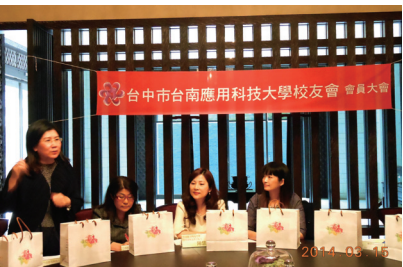
▲ 台北楊理事長特意南下支持台中校友會